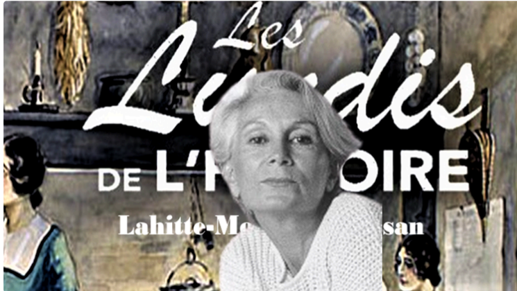
Pessan à rendez-vous avec Mme Claude