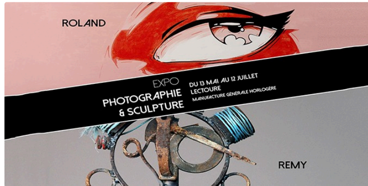
Nouvelle exposition à la Manufacture