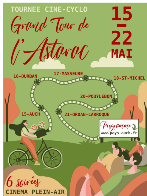
auch velo Tournee-Cine-Cyclo-2024.jpg

Pour fêter le lancement de ce premier circuit vélo en itinérance dans le Gers, le Pays d'Auch organise, du 15 au 21 mai, une tournée de 6 soirées en plein-air un peu particulières. Au programme, des documentaires, des témoignages et des rencontres pour apprendre et échanger sur les enjeux de la transition dans un cadre convivial.... le tout alimenté à la force des mollets. Chaque soirée sera organisée en partenariat avec une association locale en lien avec le thème du film projeté.