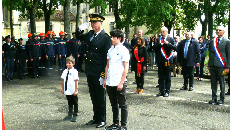
Commemoration du 8 mai, une cérémonie mise sous le signe du renforcement du lien Armées-Jeunesse

La commémoration du 79e anniversaire de la victoire du 8 Mai 1945 s'est déroulée mercredi en fin de matinée au monument aux morts de la place Salinis à Auch en présence de nombreuses personnalités civiles, militaires, et religieuses.