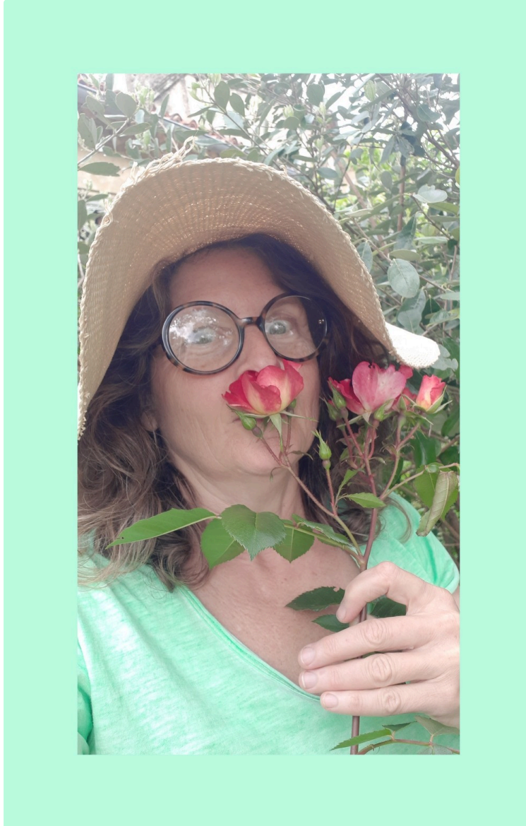
Échangez vos plantes et graines au Troc de Tachaires !

La communauté de Tachaires est heureuse de vous inviter à la 3ème édition de leur Troc de plantes et de graines, qui se tiendra samedi 18 mai de 9h30 à 12h30 à la salle des fêtes , qui sera suivi d'un repas partagé jusqu'à 14h30. Cette journée sera l'occasion parfaite pour les passionnés de jardinage et de botanique de se rencontrer, d'échanger des plantes rares et des graines, et de partager leurs connaissances