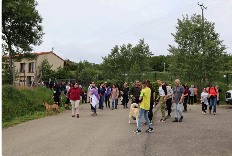
Grande réussite pour la première balade caritative de la SPA du Gers !

Samedi 4 mai a eu lieu la première balade caritative organisée par la SPA du Gers.