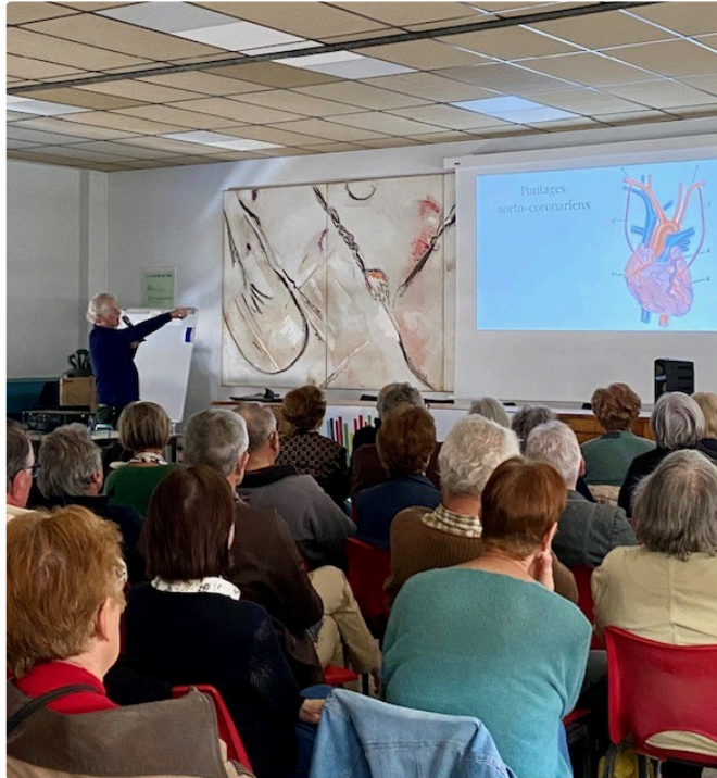
Prévenir les maladies cardiovasculaires : gros succès de la conférence organisée par la Bienfaisance

La conférence organisée par la Bienfaisance sur la prévention des maladies cardio-vasculaires a réuni plus de 80 personnes samedi 20 avril, à la salle des conférences de la mairie de Vic.