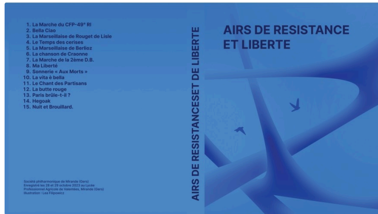
Une production musicale avec la Marche du Corps Franc Pommiès et autres titres de mémoire

Avec l'Association du Corps Franc Pommiès/49RI et la Société Philharmonique de Mirande