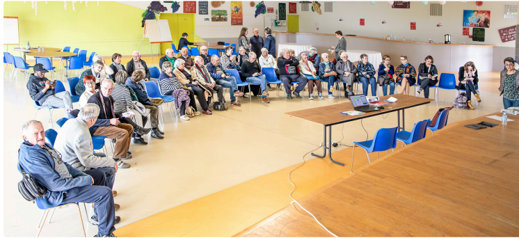
Projet d'habitat partagé à Aignan : rester acteur de sa vie et briser l'isolement

Une réunion réaliste avec les maires des communes voisines et des personnes intéressées