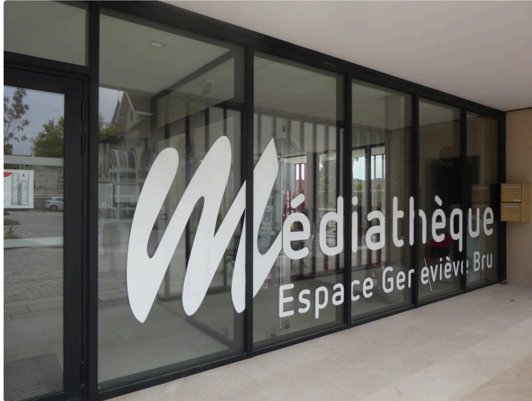
Le mois de mai à la médiathèque