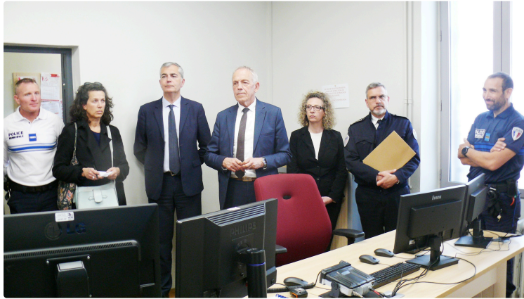
Deux mesures prises par la municipalité pour assurer la sécurité et la tranquillité des Auscitains

Il s'agit de la vidéoprotection et d'armer les policiers municipaux