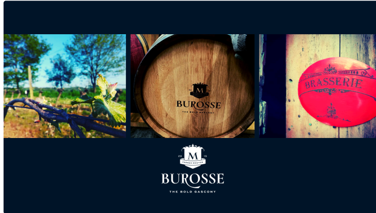
Portes ouvertes au Domaine de Burosse ce week-end