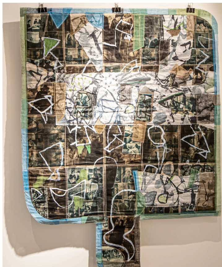
Tableau qui faisait partie de l'exposition de Michel Danton

L'association a créé un dibond (panneau publicitaire en aluminium), qui a été placé au rez-de-chaussée du bâtiment où se trouve la Galerie Bleue-Plaimont.