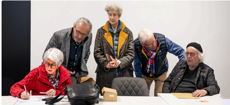
La Galerie bleue-Plaimont a tenu son assemblée générale à Saint-Mont

L'activité, soutenue en 2023, le sera aussi en 2024