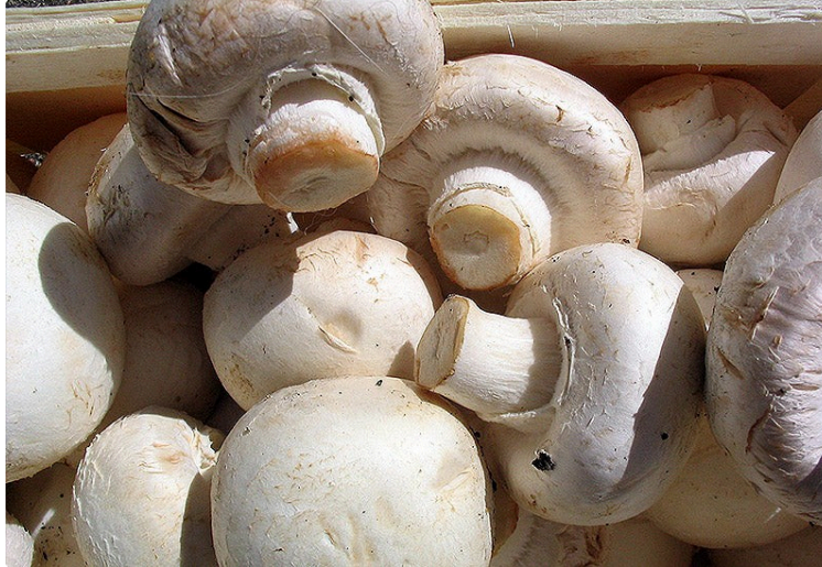
Des tonnes de champignons de Paris dans un abri atomique !

Les Vicois connaissent peu le tunnel de l'Argenté situé à l'écart de la ville.