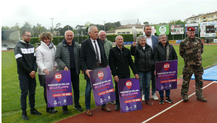
Le 18 mai, Auch va s'enflammer pour la venue de la flamme olympique

De nombreuses animations sont au programme sur cinq sites