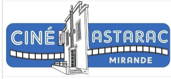
Au cinéma de l'Astarac cette semaine