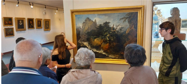
Quand les jeunes du LPA apprennent aux aînés

Belle initiative profitable aux uns et aux autres