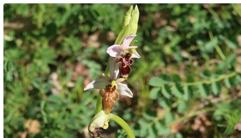
castera sentier (1).JPG