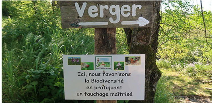
Au castéra on se retrousse les manches

Nature et Patrimoine au Castéra travaille pour la bio diversité