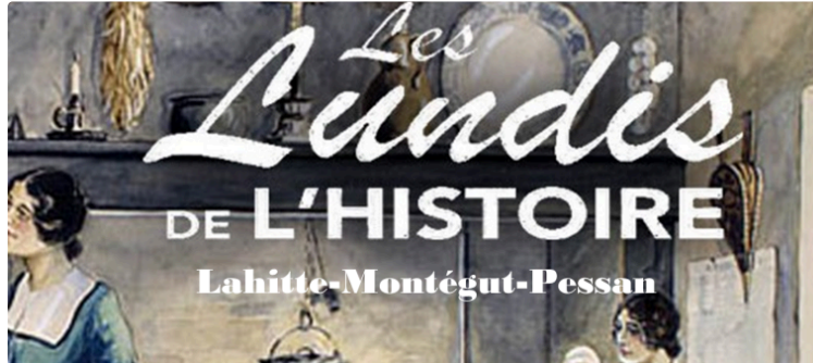
Lundi 22 avril 20h : conférence sur la terrible guerre de sécession