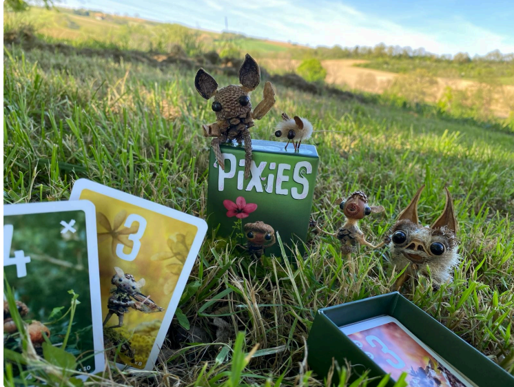
Le land-art de poche de Sylvain Trabut : après le livre, voici le jeu !

Artiste originaire du Gers, Sylvain Trabut crée un monde féérique et onirique autour de personnages de la forêt qu'il confectionne à partir de végétaux collectés dans la nature.