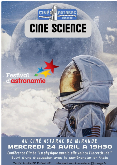
24.04.24 CINE SCIENCE PEREZ AFF.jpg