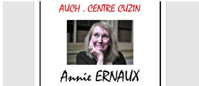
Le Griot Blanc propose la lecture de "La Place"

Une oeuvre, prix Renaudot, écrit par Annie Ernaux, première française prix Nobel de la littérature