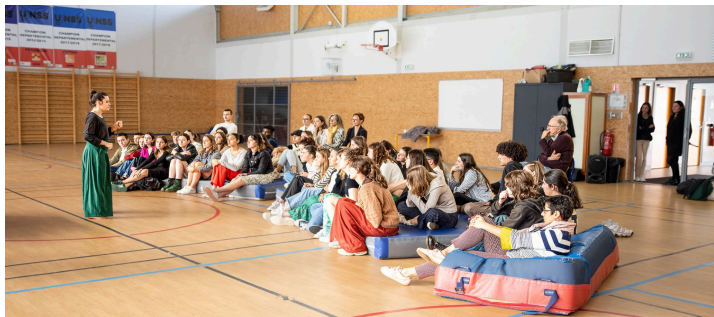
Le spectacle sur l'égalité hommes-femmes