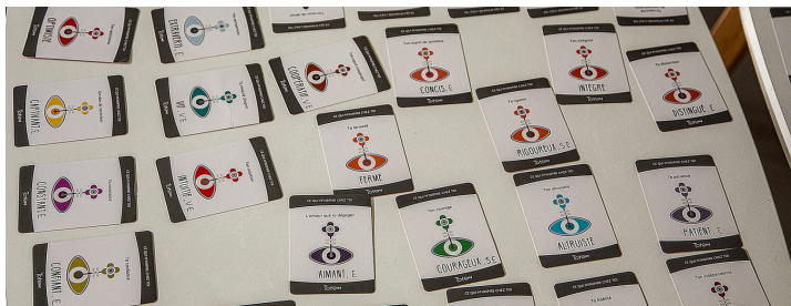
Les cartes indiquant chacune une qualité sont disposées sur 2 petites tables

Au début, chacun doit choisir une carte où figure une qualité qu'il estime avoir (ferme, aimant, intuitif, altruiste etc.), ce qui montre déjà les différences.