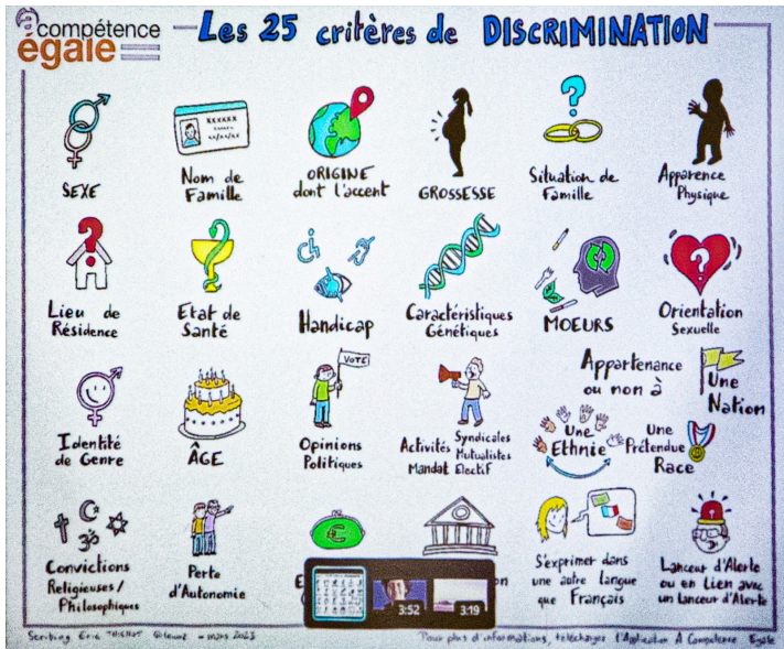
Liste des 25 critères de discrimination interdits par la loi, tels que projetés par Les Bascos

Ensuite, la liste des 25 critères de discrimination interdits par la loi est projetée et commentée.