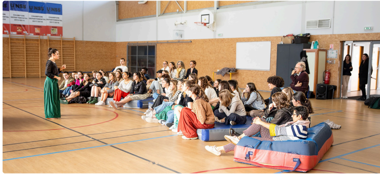
La semaine de la citoyenneté à la cité scolaire de Nogaro

Cette semaine de la citoyenneté a lieu du 2 au 5 avril 2024 à la cité scolaire de Nogaro. Elle consiste à permettre aux élèves d'échanger librement sur la construction d'une communauté de citoyens, d'une nation, selon des principes démocratiques qui s'incarnent en particulier dans les trois piliers de la devise de la République : liberté, égalité, fraternité.