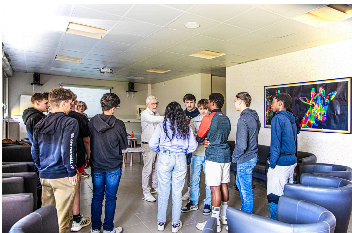
Les 3 groupes doivent discuter

Les animateurs forment 3 groupes : un groupe qui est d'accord, un groupe qui n'est pas d'accord et un groupe qui ne sait pas. Et chaque groupe doit trouver des arguments pour persuader les membres des autres groupes de les rejoindre.