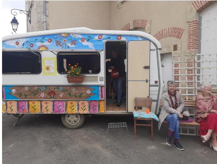
Belle réussite pour les rencontres de La Roulotte !

L'association est heureuse! "Les Colporteurs de Joie" et l'association "Les Petits Papotages" ont gagné leur pari !