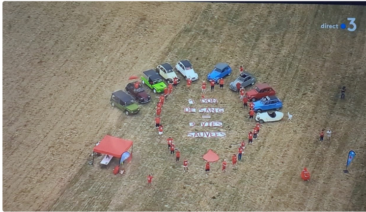
Budget Participatif Gersois : votez pour le projet de l'Union Départementale des Associations pour le Don de Sang Bénévole du Gers !

Un véhicule électrique pour toutes les amicales du don de sang permettant de réaliser une promotion plus efficace du don de sang