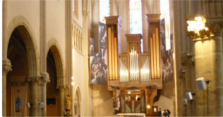
Journées Européennes des Métiers d'Art.

Samedi 6 et dimanche 7 avril, Plaisance du Gers accueille pour la première fois les Journées Européennes des Métiers d'Art.