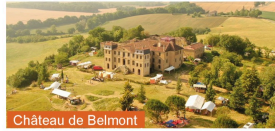
Château de Belmont

L'association Château Neuf des Peuples restaure la tour du château de Belmont pour en faire un abri de la biodiversité et un espace d'animation ! Ce projet participera à la préservation de 69 espèces dont 10 protégées et vous permettra de bénéficier d'activités pour petits et grands toute l'année dans un cadre verdoyant et historique ! Profitez d'actions écologiques et culturelles avec des plantations, des spectacles de cirque, des ateliers, des manifestations et conférences mettant en valeur le beau patrimoine de notre département tout en faisant rayonner ses savoirs-faires oubliés.