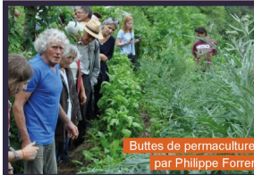
Buttes de permaculture par Philippe Forrer