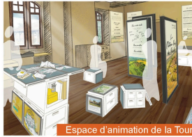
Espace d'animation de la Tour