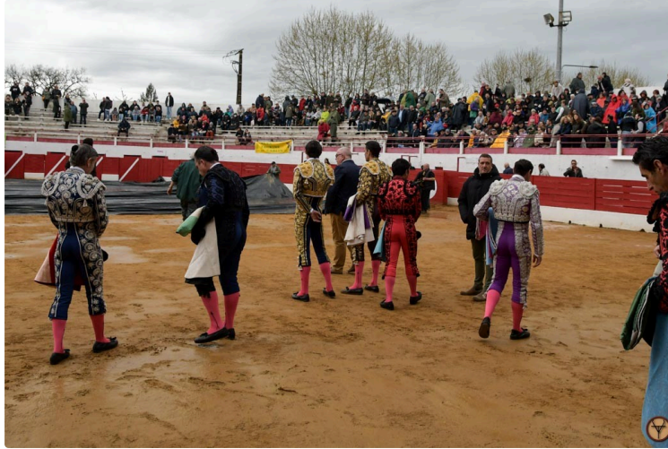
Intempéries : la corrida avec les Baltasar Iban reportée au dimanche 7 avril

La journée taurine pascalle d'Aignan avait bien commencé ce matin, même si le ciel était menaçant.