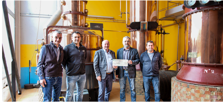
Nogaro : Sahel Gascogne reçoit un chèque de la Cave Les Hauts de Montrouge

Pour ses dernières (?) opérations au Mali au pays des Dogons