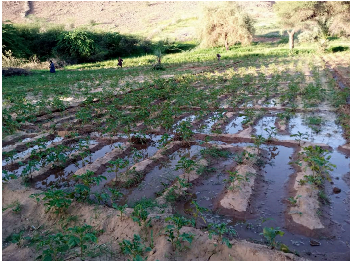
Espace maraîcher

des périmètres maraîchers féminins (les Dogons ont ainsi pris goût aux légumes),