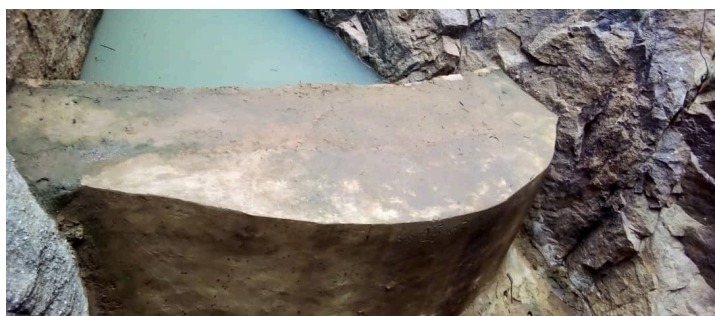
Barrage du Yéné

L'association est également intervenue pour réparer le barrage du Yéné.