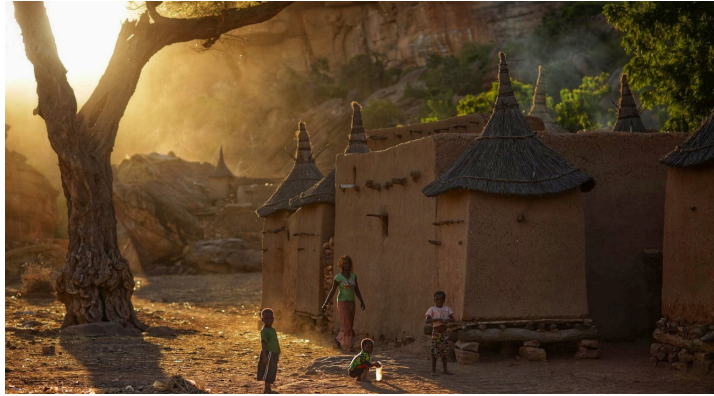
Village de Toyogu