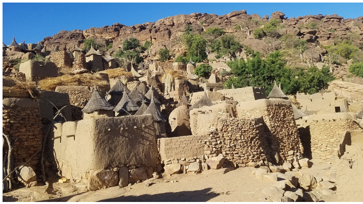
Le paysage