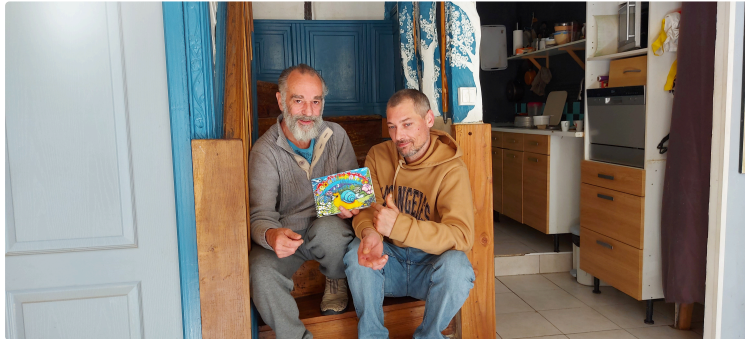
Avec le printemps, Croche Patte est de retour !