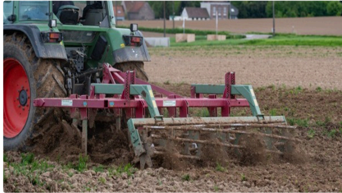
Agriculture - Reconnaissance de forces majeures semis et taille des haies

Le département du Gers a connu une fin d'automne et un hiver très pluvieux. Cette situation a eu pour conséquence d'empêcher de pénétrer dans les parcelles agricoles pour la réalisation de divers travaux, notamment les semis de cultures d'hivers et la taille des haies.