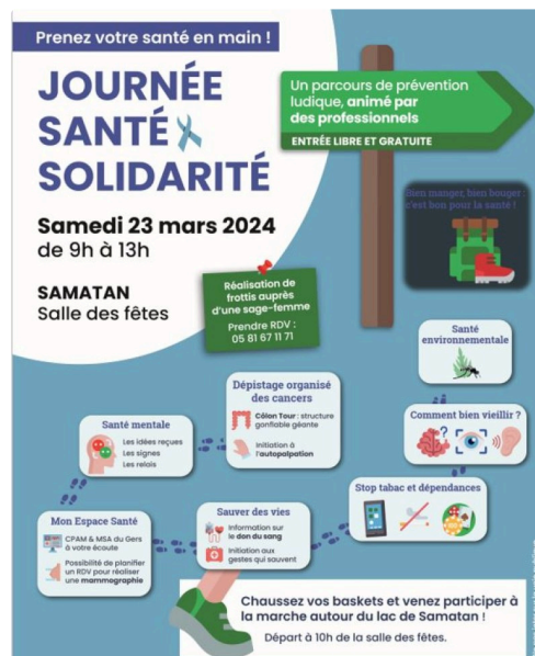
samatan sante 321.JPG