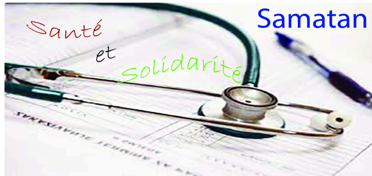
Une journée santé et solidarité demain samedi 23 à Samatan.

En ce mois de mars, la mairie de Samatan s'est volontiers investie pour permettre qu'une journée santé solidarité soit proposée aux habitants avec le soutien de nombreux partenaires.