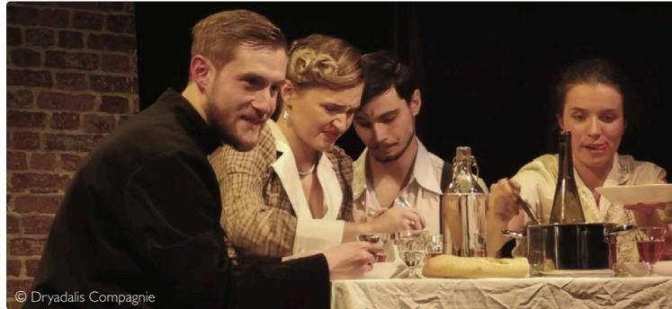
Elles ont tué le facteur du canton !