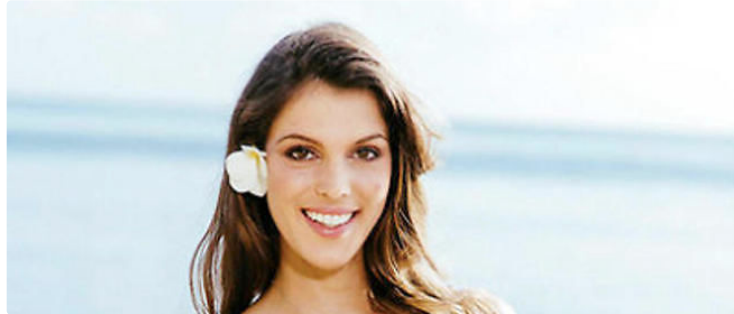
MISS FRANCE 2016

Pour la seconde année consécutive, Miss France est une miss originaire du Nord-Pas-de-Calais. Elle succède à Camille Cerf, il s'agit de : Iris Mittenaere 22 ans,