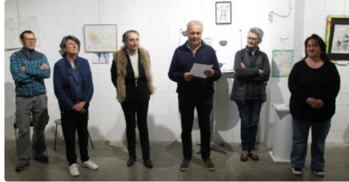
Expos éphémères de l'Atelier des Berges du Gers