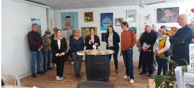
La deuxième édition du Printemps des Arts est lancée !

Samedi matin, les 24 artistes n'avaient pas tous pu se libérer pour le vernissage mais chacun avait déposé une œuvre dans les bureaux de l'Office de Tourisme