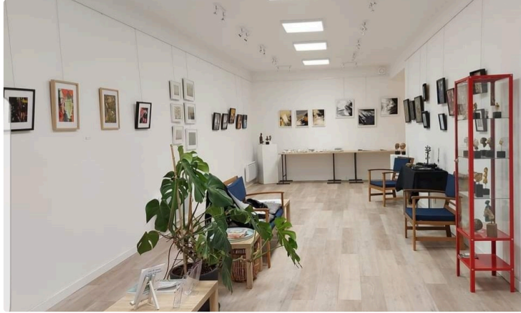
Première exposition pour débiter la série annuelle à la galerie " L'Arcade" de Saint-Clar.