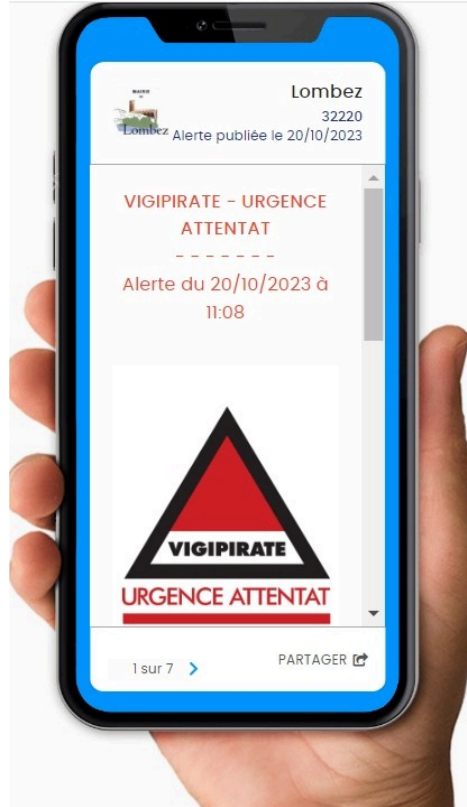
Lombez connecté à chacun de vous .

" La commune est heureuse de mettre à disposition de ses habitants l'application PanneauPocket. Par cet outil très simple, elle souhaite tenir informés en temps réel les citoyens de son actualité au quotidien, et les alerter en cas de risques majeurs. Cette solution gratuite pour les habitants, sans récolte de données personnelles et sans publicité, permet d'établir un véritable lien privilégié entre le maire et ses citoyens."