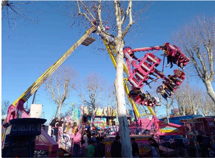
Plus que deux jours pour la fête foraine

Elle se conclue ce week-end du 16 au 17 mars