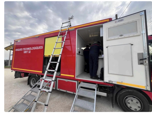
feu soufre 3.jpg