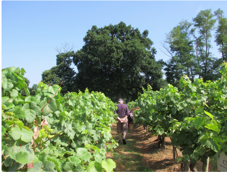
Deux randonnées culturelles organisées par Pass'en Gers

Dans le cadre de Saint Mont Vignoble en fête, Pass'enGers organise deux randonnées culturelles :