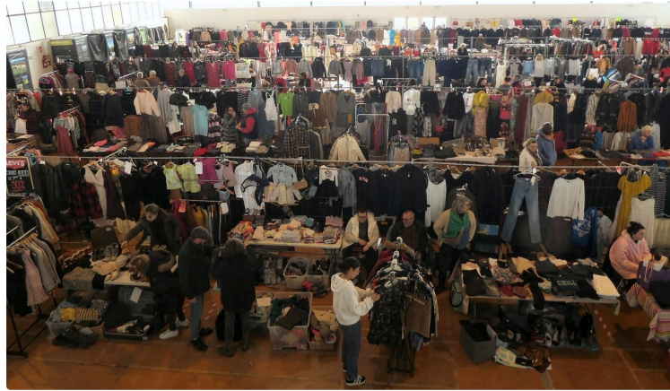
Un vide-dressing qui a tenu toutes ses promesses

Organisé par le Comité des Fêtes, sous la grande halle, ce premier vide-dressing a rassemblé pas moins de 57 exposants avec une organisation sans failles, à la grande satisfaction de tous. Une installation très fluide dès le début de la matinée, des rangées de tables bien alignées derrière lesquelles les vêtements les plus significatifs étaient mis en valeur accrochés aux gilles, de larges travées de circulation, des cabines d'essayage à la fois très fonctionnelles et panneaux publicitaires puisque grâce, à un ingénieux subterfuge, elles n'étaient au départ que le support de photos faisant découvrir le futur PNR. C'était plutôt une atmosphère de grande braderie !