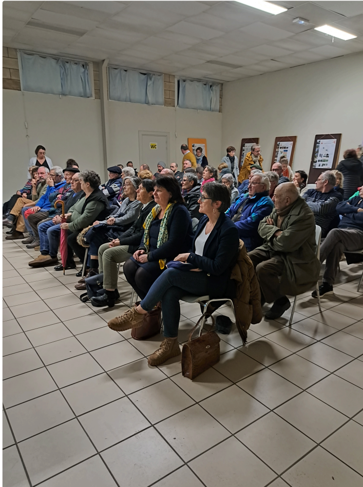
Un vaste projet prévu en différentes étapes des aménagements pour la mise en valeur de Saint-Clar.