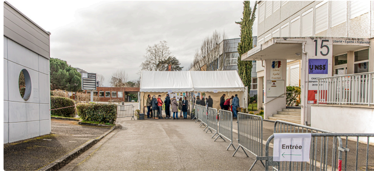
Succès des Portes ouvertes de la Cité scolaire d'Artagnan à Nogaro