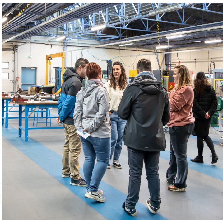
Groupe de visiteurs dans les ateliers de mécanique

On se souvient que ce dernier avait obtenu de Carlos Tavares, alors chez Renault, le don au lycée d'un camion-atelier pour le Cours de mécanique de compétition.