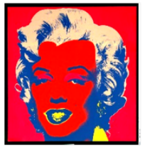
En mars avec l'UTL

"Les chroniques d'Albert" - "La photographie dans l'art contemporain" - "Le Progrès"