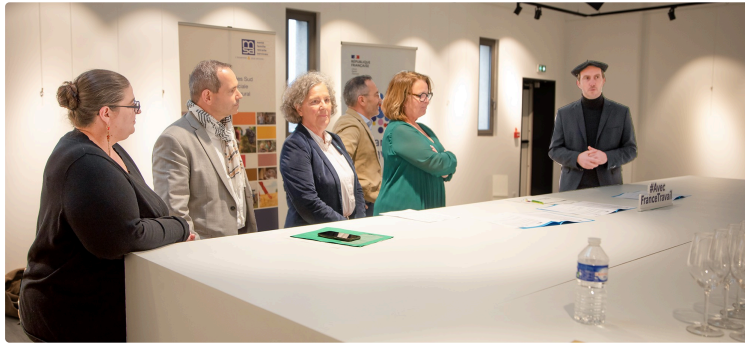
Partenariat signé chez Plaimont (Saint-Mont) entre MSA Midi-Pyrénées Sud et France Travail Gers-Hautes Pyrénées

Objectif : connaissance réciproque pour coordonner les services aux usagers et aux entreprises