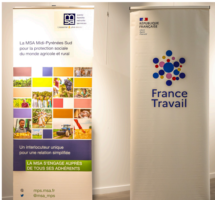
Kakemonos de la MSA et de France Travail