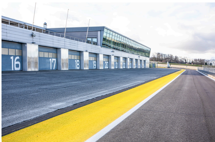
Devant les stands : les peintures

Elle nous explique que les travaux ont eu lieu du 8 au 25 novembre 2023 et ont coûté 1,5 million d'euros. Les goudrons ont été enlevés et remplacés. Des peintures vives ont été posées.