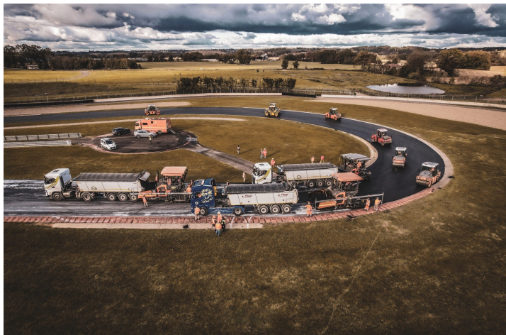
Le circuit pendant les travaux