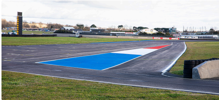
Le circuit de Nogaro s'est refait une beauté

Pour la nouvelle saison qui commence le 2 mars 2024 avec la 1e coupe des circuits