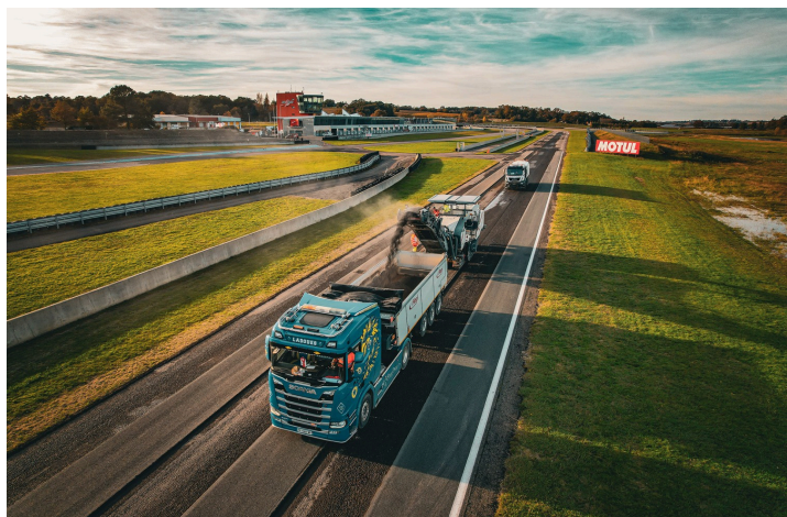
Le circuit pendant les travaux