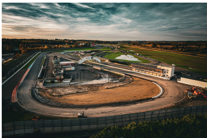
Le circuit pendant les travaux

N.B. - Sur la photo du haut de page : la piste de sortie bordée par un grand espace bleu-blanc-rouge.