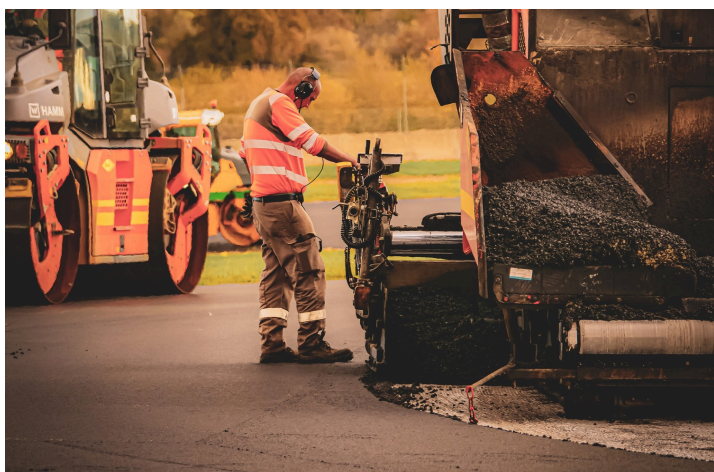
Le circuit pendant les travaux