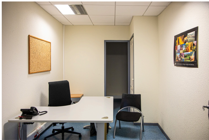
Bureau pour entretien confidentiel

Il y a chaque jour, en moyenne 10 à 12 usagers qui viennent à la MFS de Nogaro.