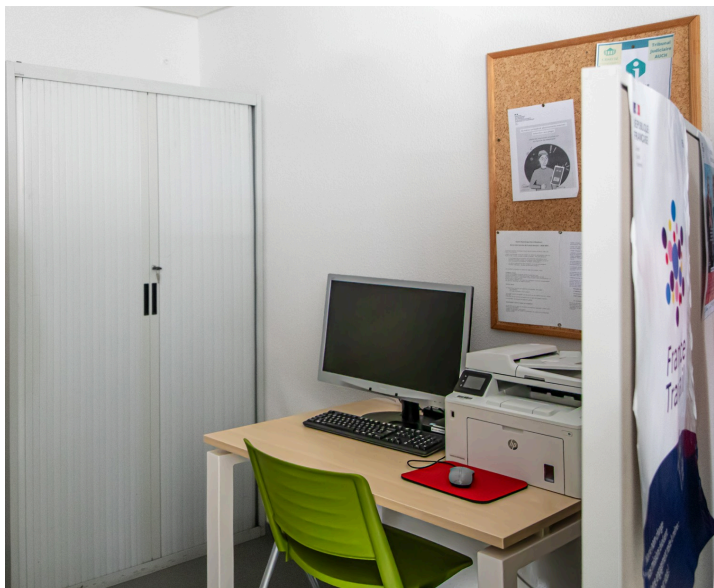
Bureau à l'écart

Ainsi qu'un bureau à l'écart, pour la personne qui vient consulter.