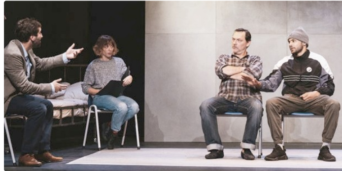
Intra muros la pièce d'Alexis Michalik en représentation à Pavie

Samedi 24 à la Salle de spectacle à 20 h 30