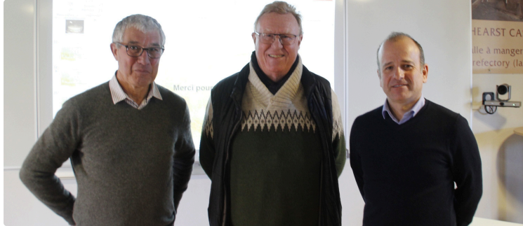
Sur les traces des moulins de Pardiac Rivière Basse